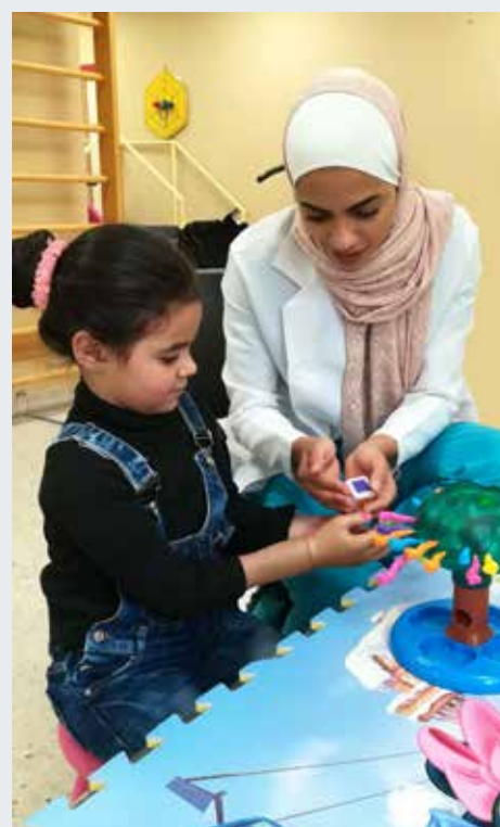
Les séances d'ergothérapie permettent aux patients de recouvrer de l'autonomie.

Enfin, les missions sociales ont été financées à hauteur de 82,5 % par la générosité publique contre 76 % en 2016.